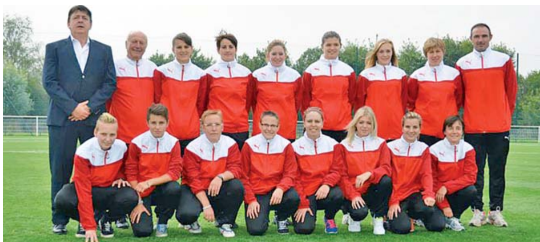
■ Le FCL organise régulièrement des événements footballistiques (rentrée du foot féminin, plateaux avec les plus jeunes...) et les matchs de D2 des féminines attirent jusqu'à 500 spectateurs !

Une logistique efficace est également primordiale : « Avec 16 équipes, il faut être en mesure de bien accueillir les rencontres qui s'enchaînent les samedis et dimanches. Heureusement, nous disposons d'installations remarquables pour une ville de 10 000 habitants, bien entretenues par les agents communaux. L'aide de la municipalité est d'autant plus appréciable que Lillers compte une grande diversité d'associations très actives. » Georges Delannoy apprécie également les soutiens du Conseil régional, du Conseil général du Pas-de-Calais et de sponsors privés, Carrefour et Intersport : « Nous avons également signé un contrat avec l'équipementier