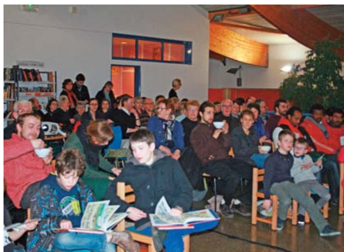
■ Un grand moment de culture-plaisir !

Le concept proposé par l'association régionale "Rencontres audiovisuelles" est si original qu'il a très vite conquis l'équipe de la médiathèque de Lillers. Ainsi pour la troisième année consécutive, le ciné-soupe itinérant fera étape dans notre ville. Le vendredi 20 février, vous découvrirez ainsi une sélection de courts-métrages d'une très grande diversité artistique. Des petits films (dont la plupart ont été sélectionnés au dernier Festival International du court métrage de Lille) nous parlent de nos vies ou mettent l'accent sur de grandes questions qui traversent la société.