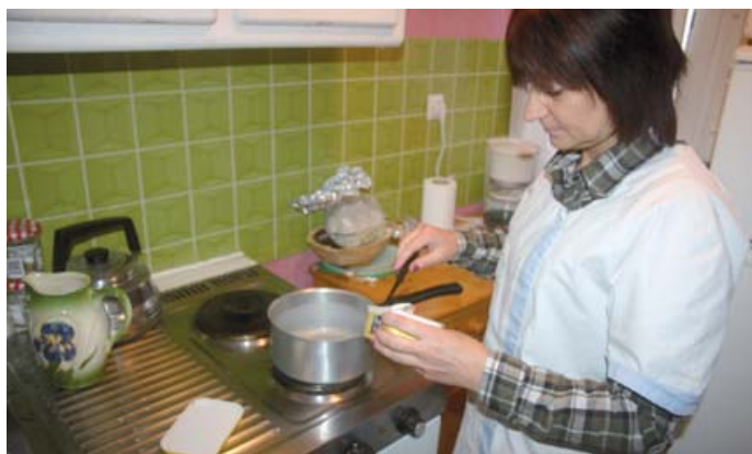
■ Un accompagnement à domicile de qualité.

Continuer à vivre chez soi, dans les meilleures conditions, malgré les difficultés liées à l'âge ! Avec la volonté de contribuer au bien-être quotidien des lillérois de 60 ans et plus, la municipalité propose les indispensables Service de soins infirmiers à domicile (SSIAD) et Service d'aide et d'accompagnement à domicile (SAAD). Ces deux services de proximité œuvrent en complémentarité dans le respect du mode de vie de chacune des personnes prises en charge. En lien avec les familles, les professionnels médicaux (médecin traitant habituel, infirmière libérale...) et les services sociaux si besoin, le personnel qualifié réalise chaque jour un accompagnement de qualité, qui s'adapte à l'évolution de l'état de santé de ses bénéficiaires.