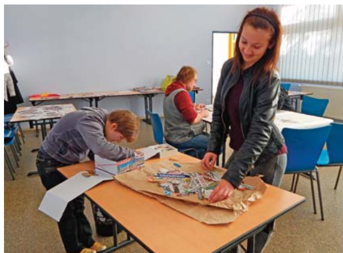
■ Découvrir de façon originale la richesse des mots.

Les premières rencontres (sur les thèmes de "cocotte parlote", ou de "mains solidaires") qui se sont déroulées en fin d'année dernière ont