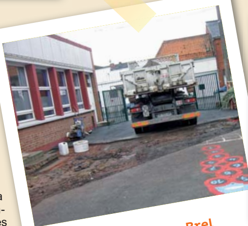
École Jacques Brel

■ École Brel , les marches de l'entrée d'une classe ont été refaites.