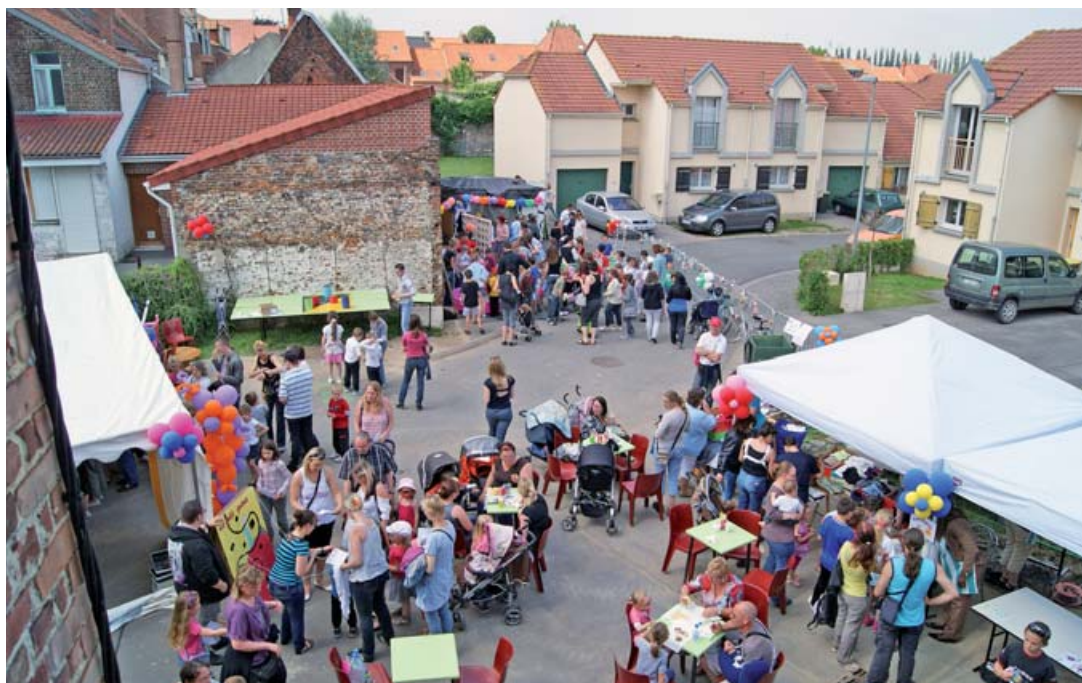
■ Créer du lien entre les générations et favoriser les solidarités !

◀ Contact : Centre social La Maison pour Tous 03 21 52 77 14 maisonpourtous@mairie-lillers.fr