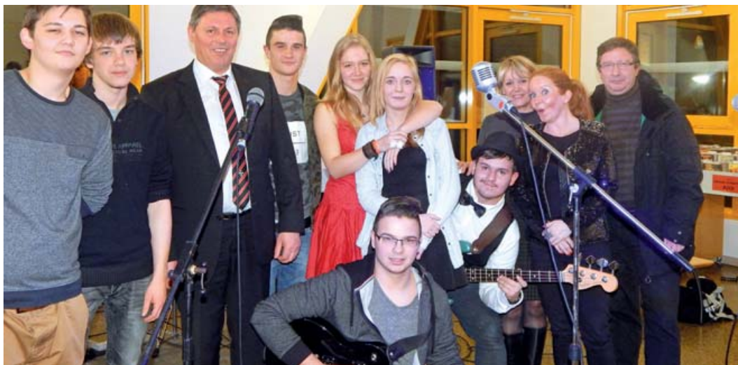
■ Soirée inaugurale en musique : les discours officiels ont été entrecoupés de mini-concerts des lycéens.

En quelques décennies, le rock est devenu un style musical majeur et incontournable. Les Lillérois ont vécu à son rythme pendant une décade inoubliable à la médiathèque et au Palace.