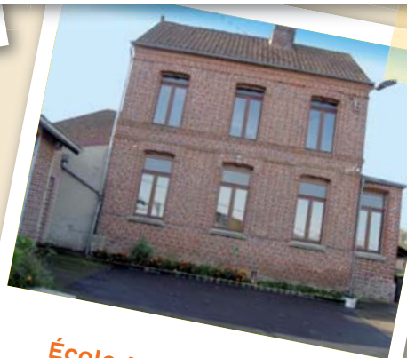
École Adrien Delehaye