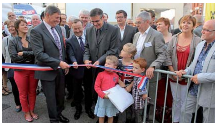
■ Un événement très réussi, grâce à l'implication de l'équipe du Comité de Foire.

Plus de 100 exposants et des milliers de visiteurs : le succès était de nouveau au rendez-vous de la dernière foire commerciale de Lillers, dont la 50 ème édition aura lieu en octobre prochain. Les artisans, les commerçants et les prestataires de services ont présenté leurs savoir-faire sur 4 000 m 2 d'exposition (dont 2 200 m 2 sous cinq chapiteaux) place Jean-Jaurès, en plein cœur de ville. Cet événement très apprécié est organisé grâce à l'implication de la belle équipe de professionnels du commerce, réunis au sein du comité de foire, et au soutien de la municipalité.