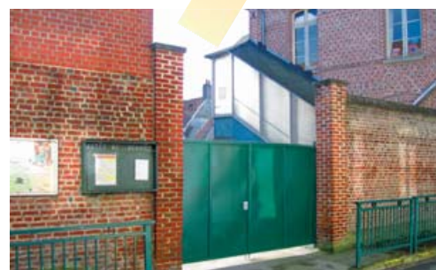
École Jacques Prévert